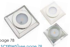
Support saillié (avec vis) voir page 78 Surface mount holder (with screws) see page 78 Dimensions : L 98 x l 98 x H 17 mm Dimensions : L 98 x W 98 x H 17 mm